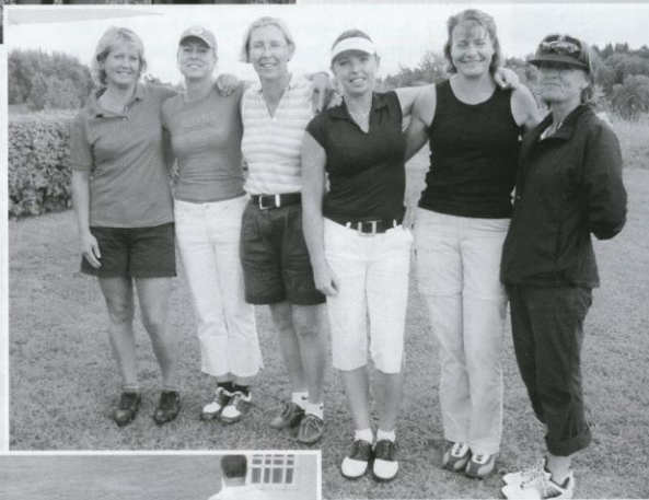
KM Foursome Damer