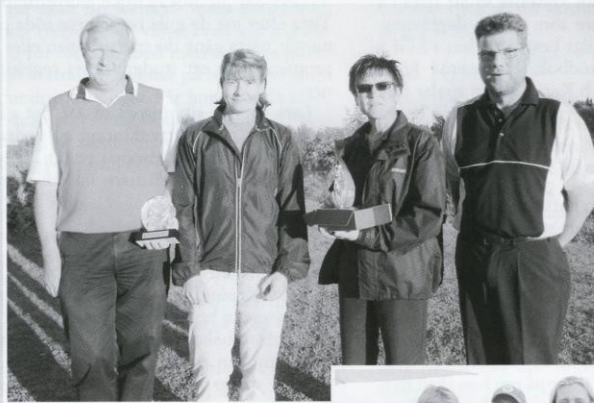
Vinnare Duka Trophy