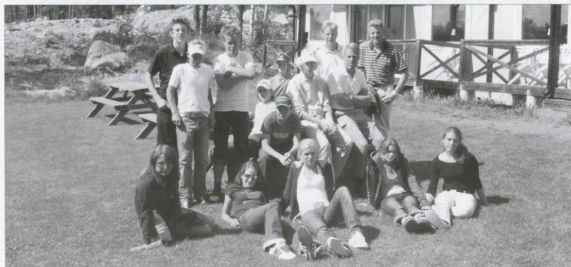
Gänget samlat inför hemfärd.