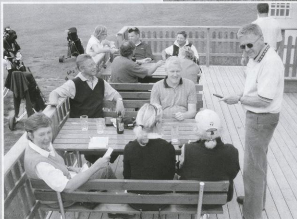
Styrelsen på utflykt