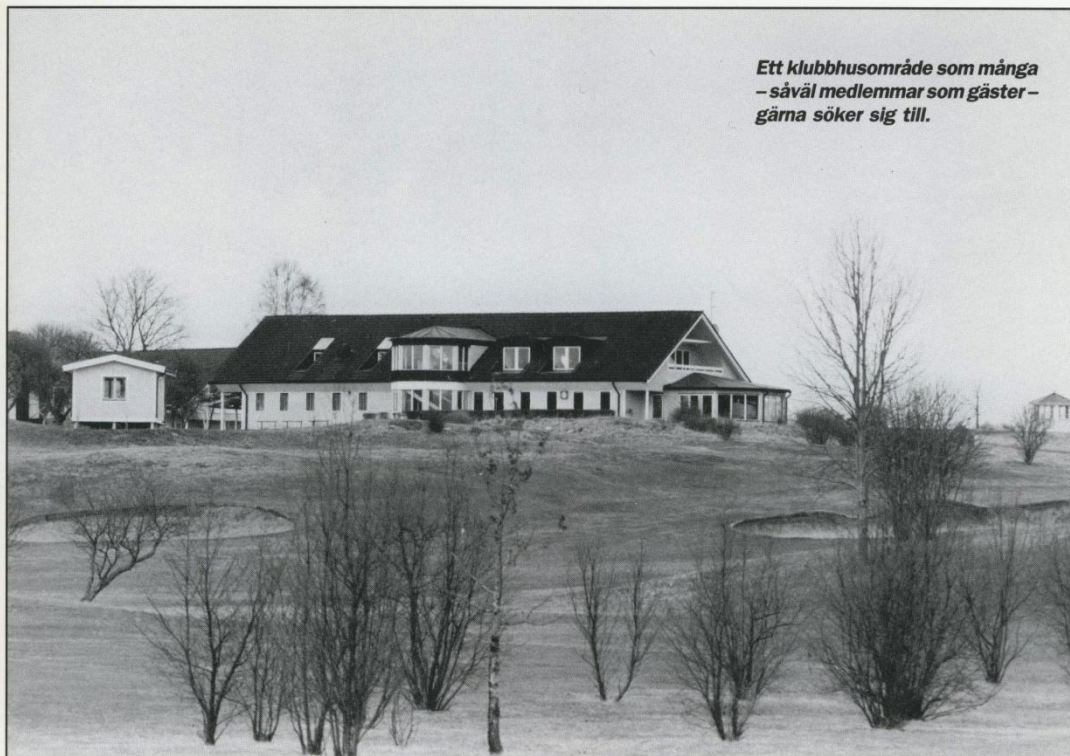
Ett klubbhusområde som många – såväl medlemmar som gäster – gäma söker sig till.