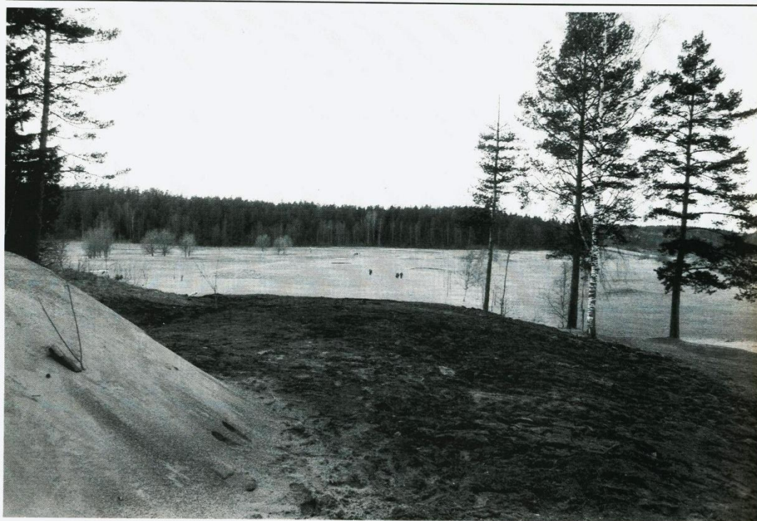
8:e tee får en rejäl ansiktslyftning. Det blir bredare, längre och luftigare än tidigare. Ny dränering har lagts ned så att vi ska få en så torr och bra utslagsplats som möjligt.