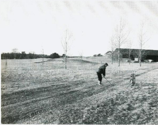
Vinterspel på snöfri bana. Ja, praktiskt taget hela vintern har det gått att spela på vår bana. Det lilla snötäcke som fanns före jul försvann tämligen omgående och banan har sedan dess varit välbesökt. Normala vintrar brukar den ju vara ett populärt mål för kommunens skid- och pulkåkande familjer.

tre olika avstånd. Vi kommer att sanddressa fram greenliknande ytor och lägga dem i motlut på ett sådant sätt att de syns.