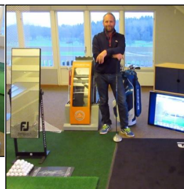
En av "studiomännen"