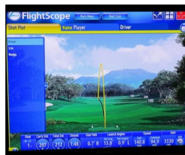
Många värden att diskutera