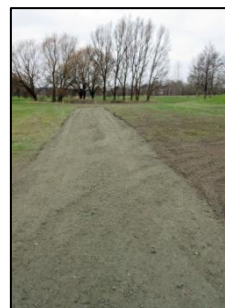
Nya transportvägen mot tee 49 på nian från 17:e hålet förbi artons tee