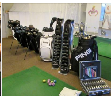
PING är en av leverantörerna till studion. Cobra och Callaway på gång.