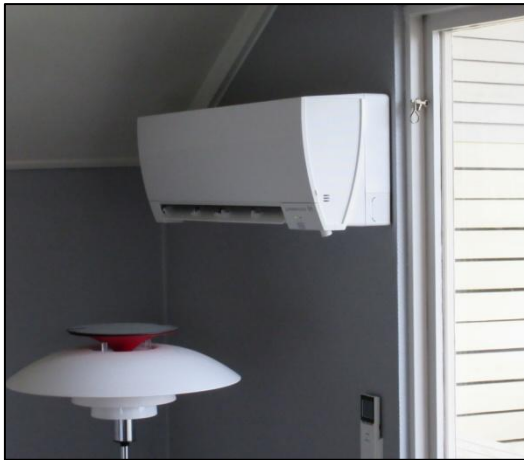
Luftvärmepumpar i studion