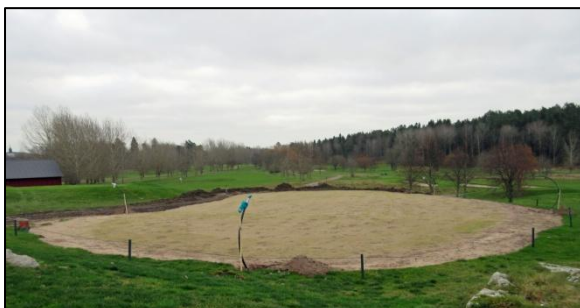
Omläggningen av nya övningsgreenen har gått vidare