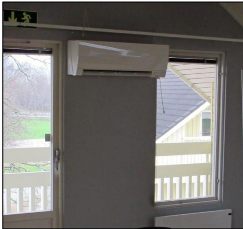
och i möteslokalen

Övervåningen på vår golfklubb har varit en outnyttjad resurs på den kalla delen av året. Det beror på att den totala installerade värmeeffekten via radiatorerna har varit för låg för att hålla temperaturen på en normal nivå. Dessutom var en stor del av radiatorerna så gamla att de var ur funktion. Vi började med att byta ut radiatorer under våren, med vetskap om att det inte skulle räcka men då fick vi en grundvärme. Nu har vi kompletterat med två luftvärmepumpar så nu går det att vara i lokalerna hela året, för olika aktiviteter, utan ytterkläder.