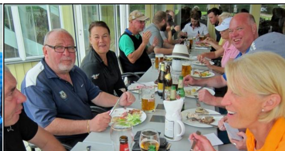
Dansk buffé intas