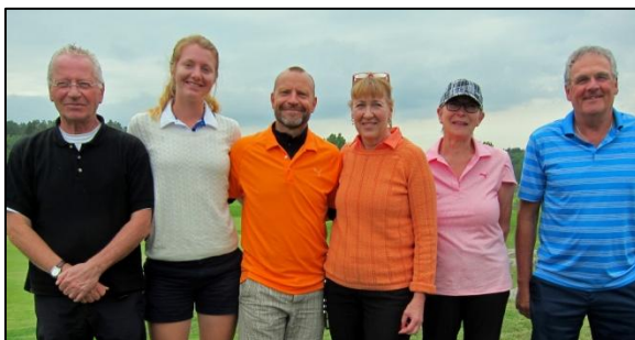
Pristagarna i Nationaldax