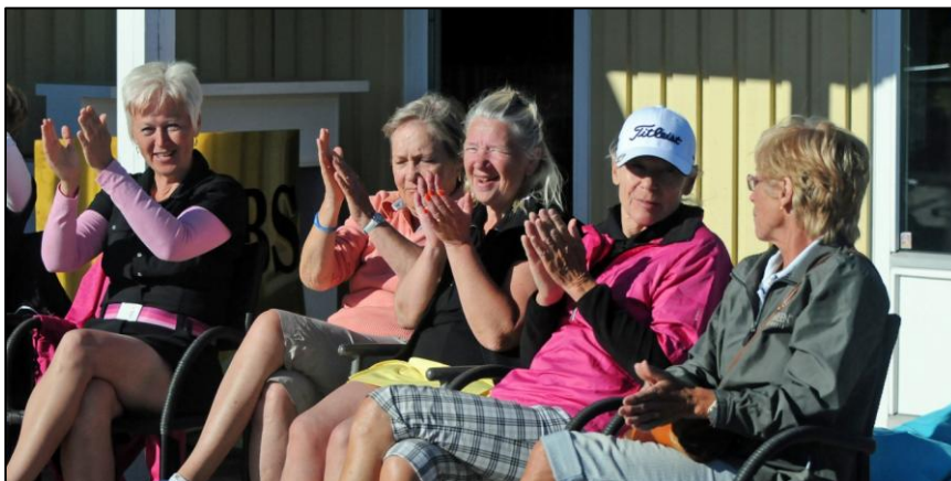
Entusiastisk publik vid prisutdelningen