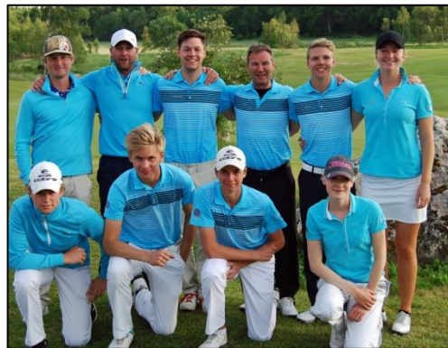
Lag-SM juniorer kval på Wäsby GK