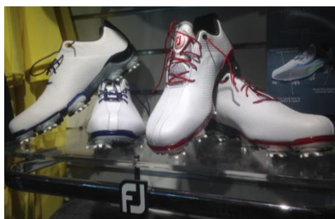
20 % på skor & pikéer från Footjoy!