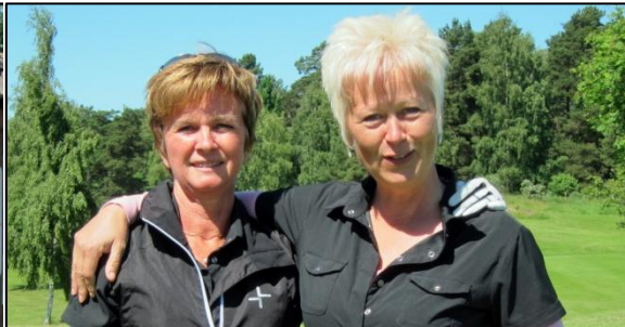
Skall vi vinna i år?

På herrsidan ställde 10 av de 58 med lägst hcp upp i tävlingen. Kanske ganska typiskt för KM numera i de flesta svenska klubbar. På försök spelades i år KM FS över 18 hål. Motivet var dels beläggningen på helger men också insatsen av tävlingsledare. För 18 hål krävdes 7 timmars tävlingsledning som skulle varit minst 12 timmar om tävlingen spelats över 36 hål. Var finns ytterligare frivilliga som vill ställa upp för klubben??