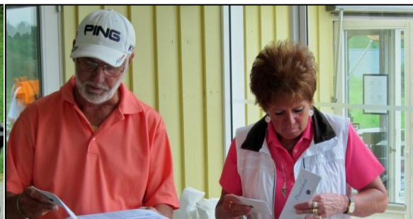
I full action vid prisutdelningen