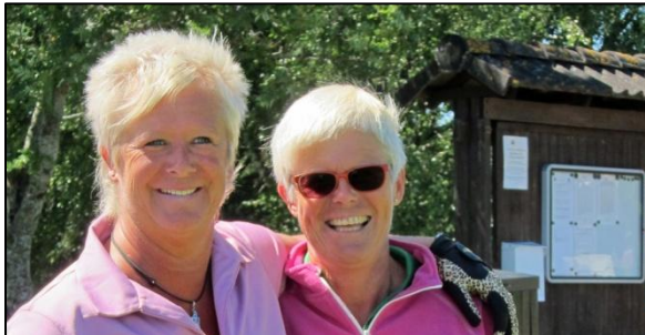
Stora förväntningar före start

KM Foursome Damer och Herrar genomfördes lördag 14/6 med 9 par i damklassen och 15 par i herrklassen.