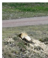
Bävaren ger sig inte