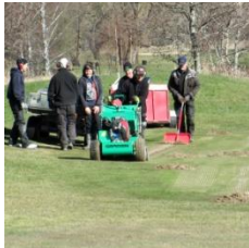
Grading på 5:an