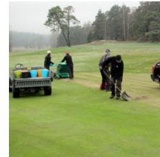
Grading på 9:an

Greenerna har bearbetats så att nytt mtrl har förts in med s.k. grader, ca 10 % av greenytan har ersatts med ny sand så att gräset ska må bra. Med det får vi fina ytor att spela på under säsongen. Det här låg tidigare i en långtidsplan för renovering av greenerna men ingår numera som en del av vårt vårarbete. Detta måste nu göras regelbundet då vi välter våra greener på ett helt annat sätt än tidigare.