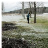
Städdagen som inte blev av