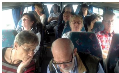
Även kultur trötta