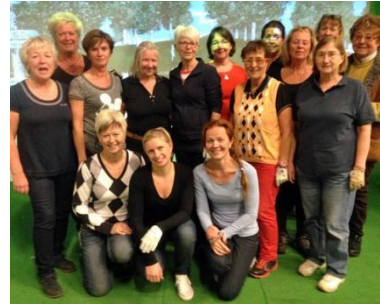
Damträff på Inhouse