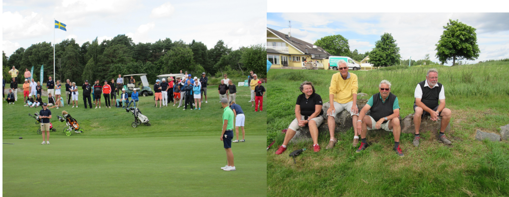
Spelare och publikbild

”Jag är riktigt nöjd och vet att även spelarna är det. Inte bara över att banan var så fin utan även för att alla på klubben var engagerade i tävlingen och välkomnande mot spelarna. Jag kommer inte glömma dessa dagar i första taget, det har varit så enkelt att jobba med alla och samarbetet har fungerat utmärkt.”