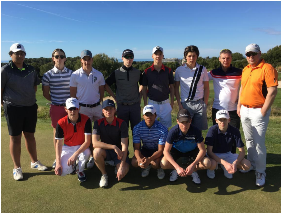
Spel och träningsvecka i Spanien

Hoppas nu att spelet som visades upp under JSM på vår fina bana och Stensons majorvinst på The Open ytterligare inspirerat våra ungdomar till nya framgångar. Springer du på någon av våra engagerade och duktiga juniorer så ge dem en klapp på axeln och några positiva ord för det är de värda!