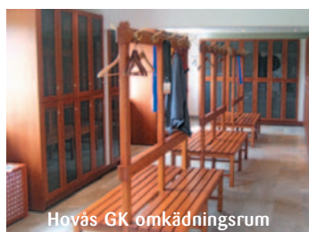
Hovås GK omklädningsrum