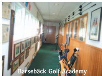
Barsebäck Golf Academy