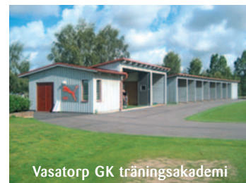
Vasatorp GK träningsakademi