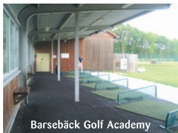
Barsebäck Golf Academy

Här nedan ser ni några inspirationsbilder från golfanläggningar jag besökt under sommaren.