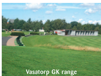
Vasatorp GK range