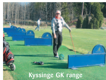
Kyslinge GK range