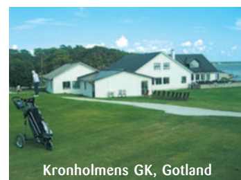
Kronholmens GK, Gotland