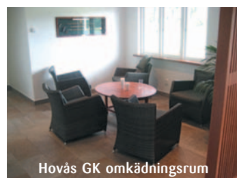
Hovås GK omklädningsrum