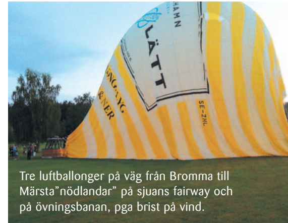
Tre luftballonger på väg från Bromma till Märsta "nödländar" på sjuans fairway och på övningsbanan, pga brist på vind.

hela rangen så att de som passerar på infarten skall vara extra skyddade. Riktiga nät ger oss också framtida möjligheter att erbjuda bättre bollar på rangen.